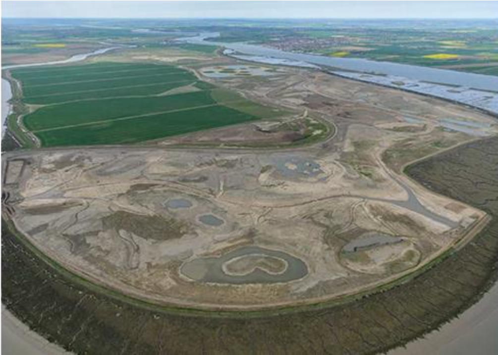
Mynd 2. Wallasea eyja þegar framkvæmdir eru hafnar.

Á mynd 3 (Institution of Civil Engineers) er aftur á móti sýnt hvernig framtíðarsýn fyrir þetta svæði er. Þar er gert ráð fyrir að þarna verði útivistarsvæði með göngustígum og aðstöðu til fuglaskoðunar og annarrar útivistar. Þar er einnig gert ráð fyrir að það landbúnaðarland sem enn er á eyjunni eigi að víkja fyrir auknu votlendi á svæðinu.