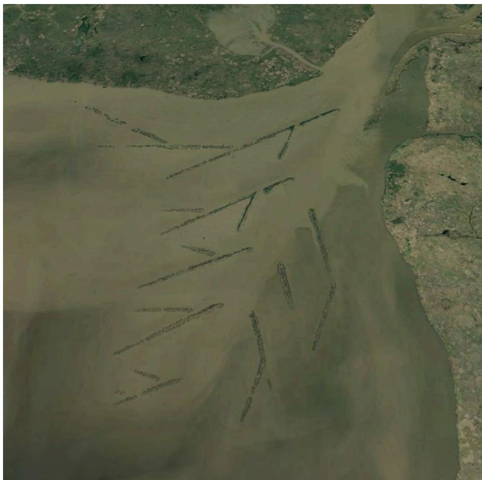
Mynd 8. Mynd af tilraunasvæðinu tekin af Google earth í febrúar 2018.

Það virðist vera að á þessu svæði í Louisiana og öðrum fylkjum þar um kring sé víða verið að endurheimta votlendi. Í skýrslu um endurheimt við Mississipi ána var fylgst með svæði sem var að mestu undir vatni 1978 sjá mynd 9. Fylgst var með svæðinu og teknar gróðurgreiningar og fluttar til plöntur og þannig settist leir og sandur í svæðið og fyllti mikið upp í svæðið (Cahoon, Donald R., 2010).