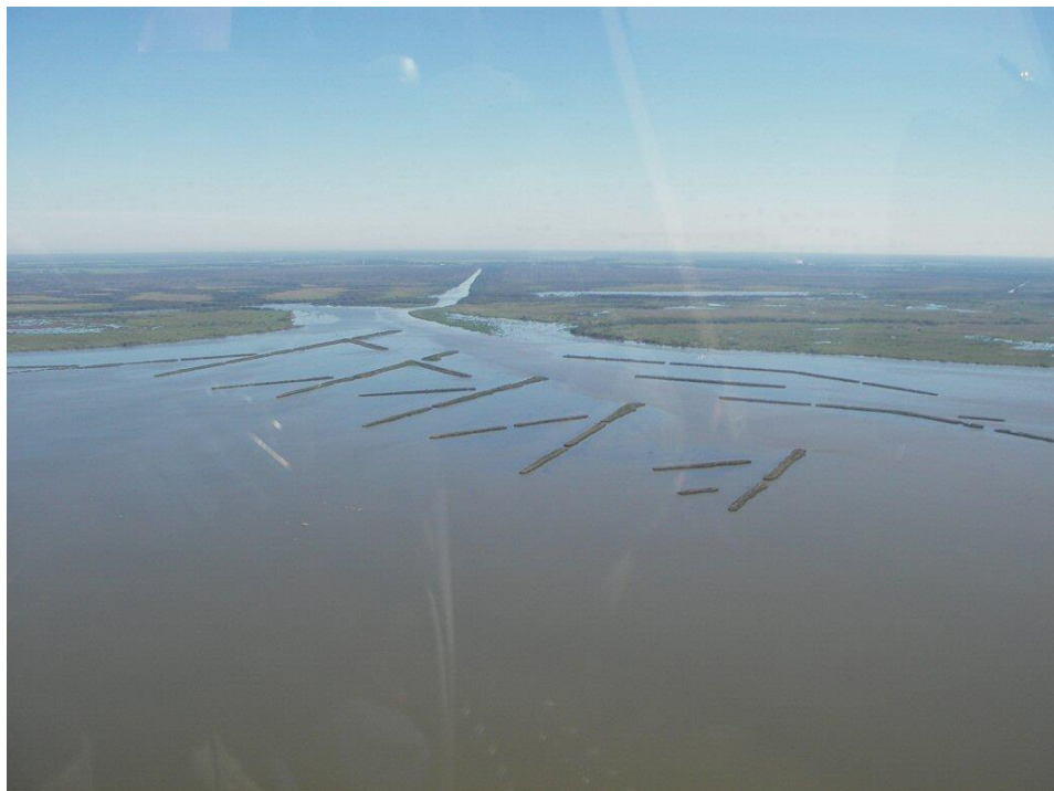
Mynd 6. Mynd af svæðinu „Sediment trapping at the Jaws project“.

Á þessum stað var farin blönduð leið þ.e. bæði að hafa tré og lávaxnari plöntur. Í skýrslu sem gefin var út 2016 (Aucoin, Stan 2016) segir að þetta sé 20 ára verkefni sem hófst árið 2005. Talið er þegar tímabilið er hálfnað að verkefnið gangi vel og ekki sé ástæða til frekari inngripa. Mynd 8 er gervitunglamynd sem tekin er á þessu svæði þann 21. janúar 2015 (Google Earth Pro). Hún er því tekin á saman tíma og skýrslan var gefin út.