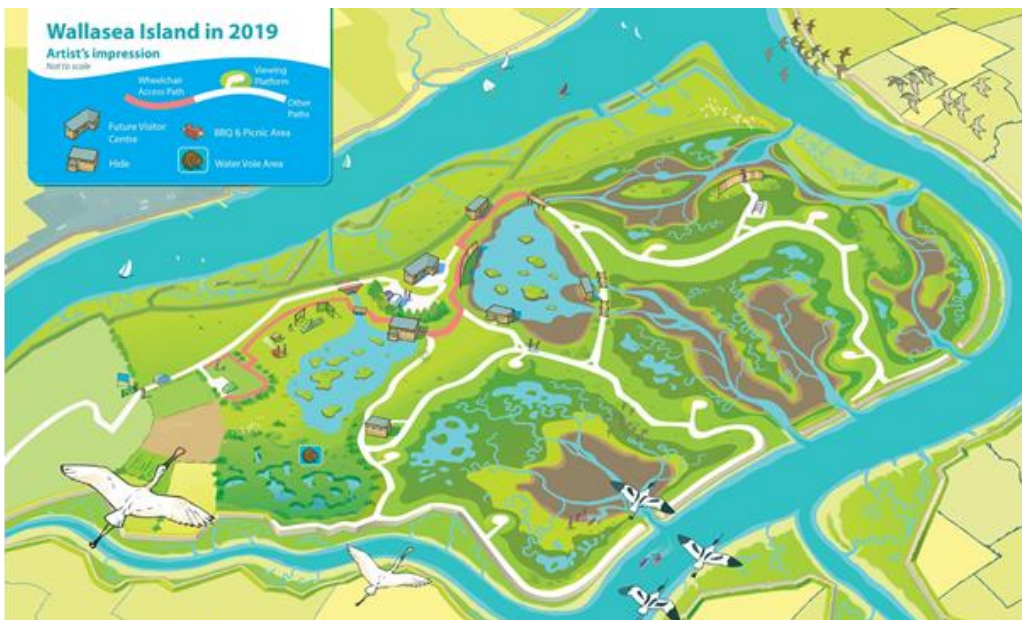
Mynd 3. Framtíðarskipulag á Wallsea eyju 2019.

Á mynd 3 (Institution of Civil Engineers) er aftur á móti sýnt hvernig framtíðarsýn fyrir þetta svæði er. Þar er gert ráð fyrir að þarna verði útivistarsvæði með göngustígum og aðstöðu til fuglaskoðunar og annarrar útivistar. Þar er einnig gert ráð fyrir að það landbúnaðarland sem enn er á eyjunni eigi að víkja fyrir auknu votlendi á svæðinu.