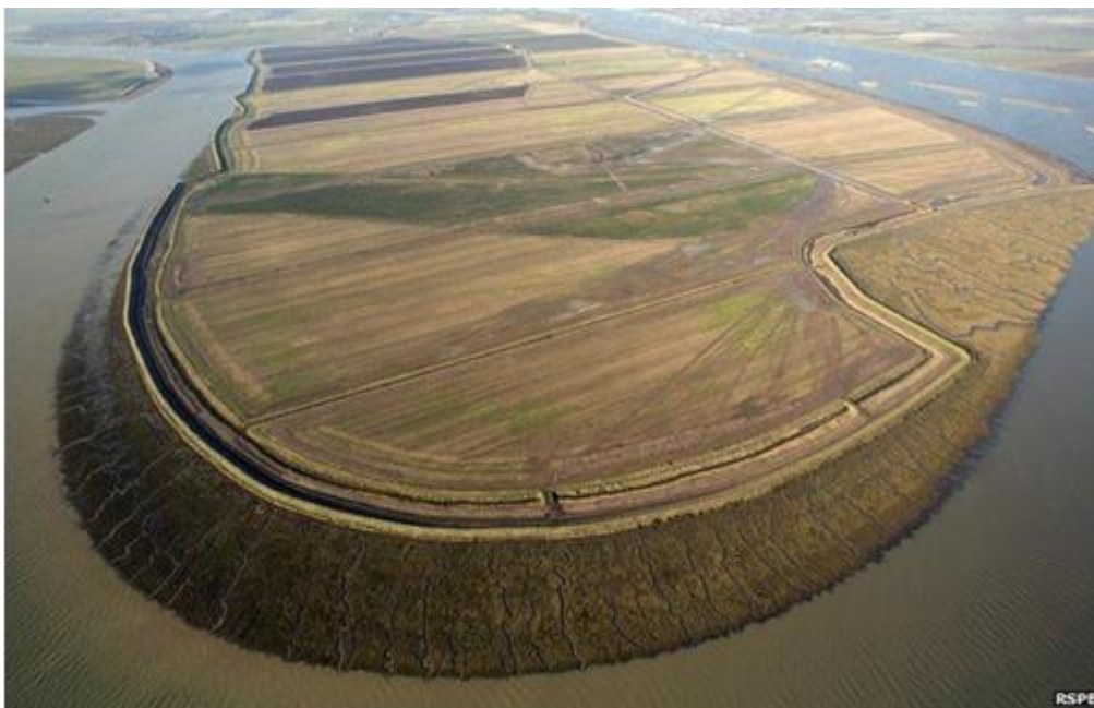
Mynd 1. Wallasea eyja áður en ráðist var í framkvæmdir (Associated British Ports Holdings Ltd).