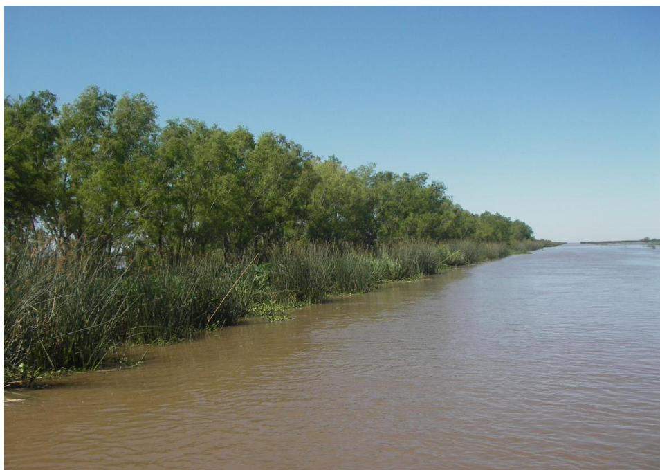
Mynd 7. Hluti af tilraunasvæðinu.

Á þessum stað var farin blönduð leið þ.e. bæði að hafa tré og lávaxnari plöntur. Í skýrslu sem gefin var út 2016 (Aucoin, Stan 2016) segir að þetta sé 20 ára verkefni sem hófst árið 2005. Talið er þegar tímabilið er hálfnað að verkefnið gangi vel og ekki sé ástæða til frekari inngripa. Mynd 8 er gervitunglamynd sem tekin er á þessu svæði þann 21. janúar 2015 (Google Earth Pro). Hún er því tekin á saman tíma og skýrslan var gefin út.