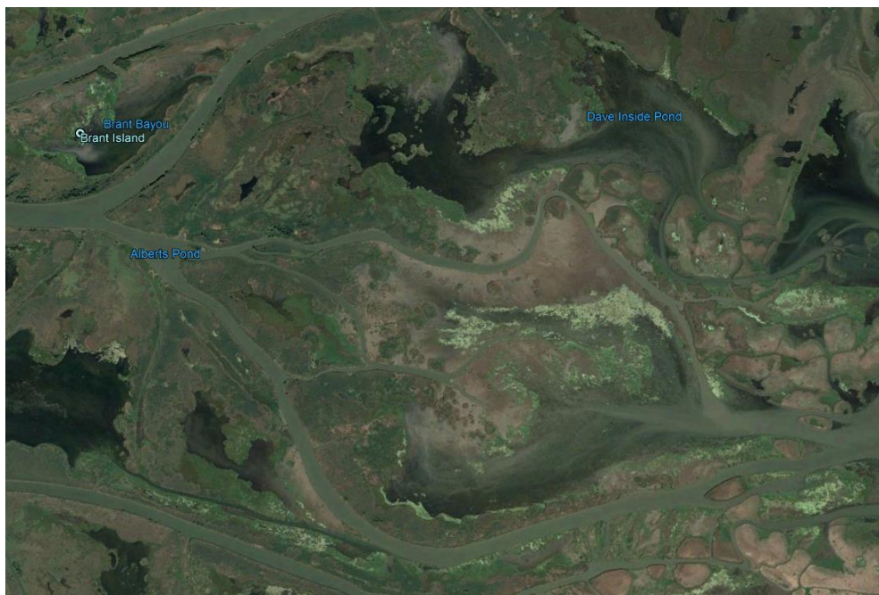
Mynd 10. Loftmynd tekin af Google earth í febrúar 2018.

Á mynd 10 má sjá að svæði undir vatni hefur minnkað enn frekar og gróður aukist frá árinu 2000. Myndin á Google earth var tekin 21. nóvember 2016 (Google Earth Pro).