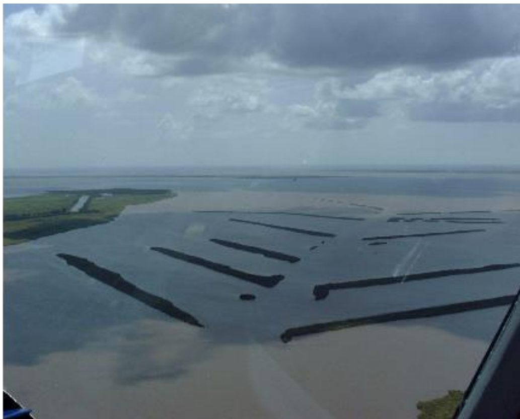
Mynd 4. Varnargarðar sem gerðir voru við Little Vermilion Bay.

hávxinni strandplöntu ( Spartina alterniflora ) í varnargarðanna (Louisiana Coastal Wetlands Conservation and Restoration Task Force 2010).