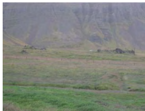
Mynd 5. Litlaborg.