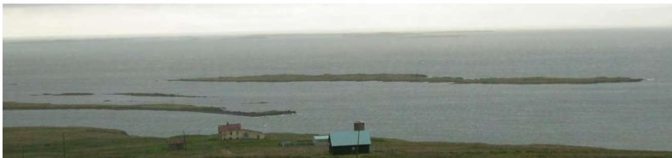
Mynd 10. Heinabergsey/Stefanía er stærsta eyjan fyrir utan.