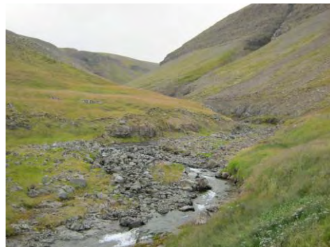
Mynd 13. Nípurá.