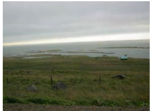
Mynd 11. Langhólmi sést þarna. Lengsti hólminn vestan við sumarhúsið.