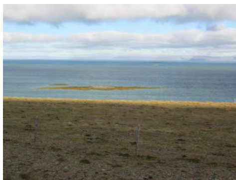
Mynd 16. Reiðhvammssker.