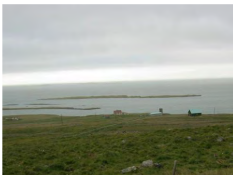
Mynd 1. Heinaberg.

Heinaberg er jörð í fyrri Skarðshreppi næst innan við Níp, en utan við Ytri- Fagradal. Bærinn stendur niður við sjó fram á lágum hömrum. Sagnir voru um mikið surtabrandstré í fjöru Heinabergs sem nú er líklega hulið sandi. Túnin spillast lítilsháttar af grjóti sem upp úr því kemur. Engjar spillast af skriðum og vatnsuppgöngum, en hagar fordjarfast af skriðum.