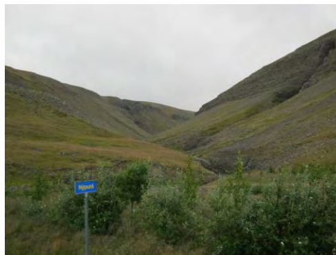
Mynd 3. Nípurdalur.