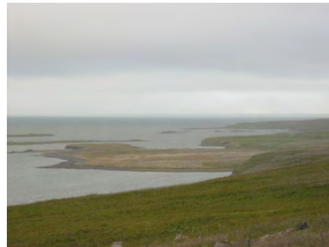
Mynd 14. Steinseyri.