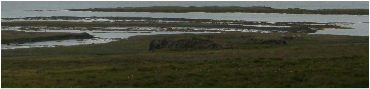
Mynd 6. Heinaberg.