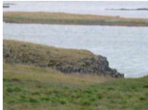
Mynd 7. Beinagjá.