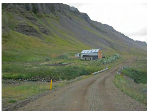
Mynd 12. Sumarbústaðurinn á Níp.

Níp er jörð sem staðsett var í Skarðshreppi, næst innan Tinda. Bærinn hefur löngu verið fluttur út fyrir ána, virðist hafa verið í Heinabergslandi áður vegna og var fluttur vegna skriðuhættu, en nú er stekkur þar sem hann stóð fyrr. Sagt er, að fjárhúsin hafi alltaf verið fyrir utan á og 19 menn hafi farist í ánni, enda er vaðið vont á svaðarhellum ofan við allháan foss. Upplýsingarnar í örnefnaskránni eru frá Stefáni