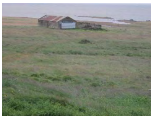
Mynd 4. Þóruþúfa.