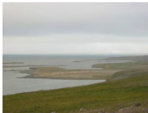
Mynd 9. Stekkjarnes.