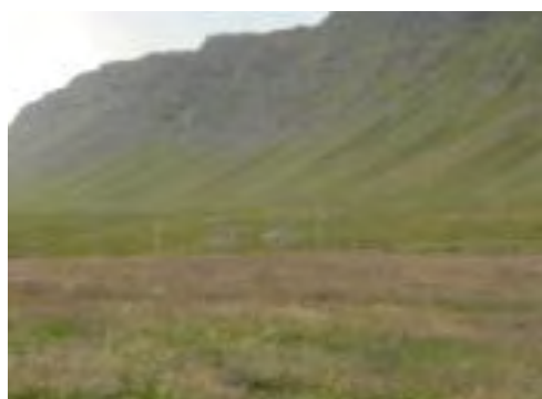
Mynd 8. Á miðri myndinni sjást Stapar.