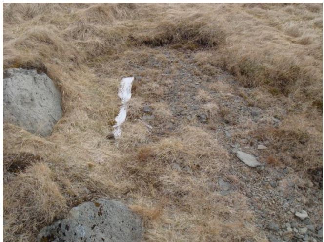
Mynd 2. Naust þar sem bátur hefur verið geymdur, myndin er tekin í suður.