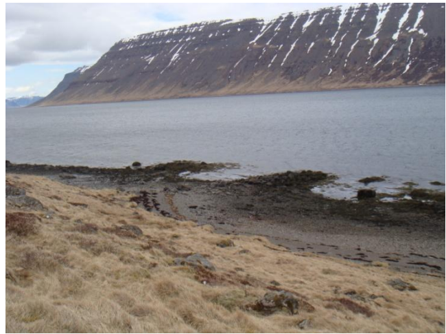
Mynd 1. Lendingin, myndin er tekin í norður.

Naustið er niðurgrafið og er stórt grjót við austurhlið þess en ekki nein merki um