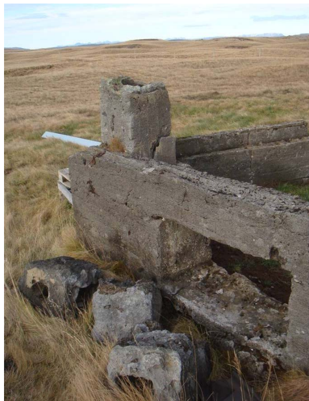
Mynd 5. Rústir af Rjómaskála frá byrjun síðustu aldar.

Í örnefnakrá fyrir Hellar og Múla segir „um 400 metra suður af Smalaskálanefi eru rústir rjómabús, sem rekið var í byrjun þessarar aldar þarna fram við lækinn. Síðar var þar um skeið samkomuhús hreppsþúa. Nú stendur þarna eftir reykháfurinn“ einnig stendur í annarri örnefnaskrá „Fyrir vestan veginn stendur smjörgerðarhús Landmanna kallað Rjómaskáli“. Um 32 metra austur af sumarþústað fast við