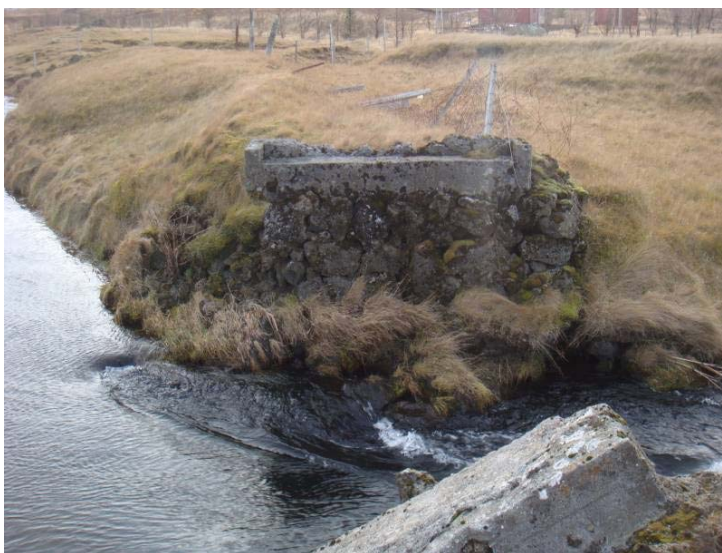
Mynd 6. Leifar af brú yfir Minni-Vallarlæk.

Í örnefnalýsingu segir: „Hann er rétt sunnan við gamla þjóðveginn, sem í notkun var fram um eða rétt eftir 1940, og sýndur er á eldri útgáfum af herforingjaráðskorunum . Vel mótar fyrir vegi enn; hann lá yfir brú hjá rjómabúinu og þar til norðausturs“.