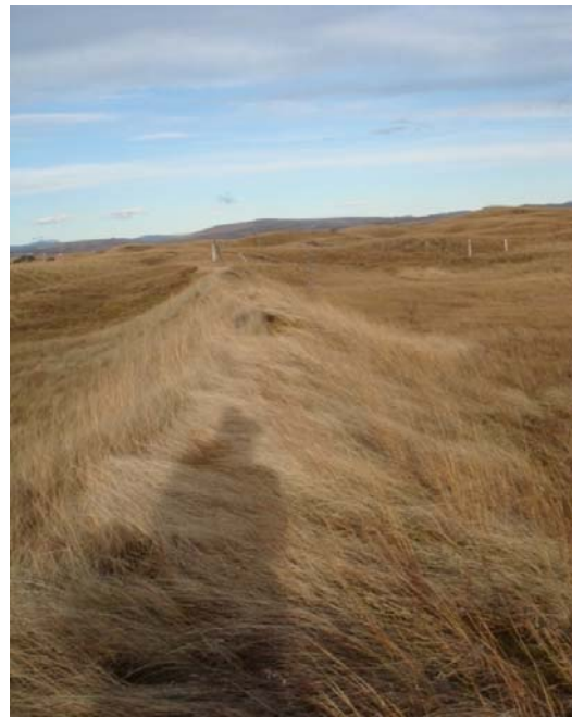
Mynd 8. Sandvarnargarður sem liggur til norðurs.

Rétt við ána um 140 metrum af brúnni er sandvarnargarður. Garðurinn liggur nærri einum af eldri sumarbústöðum á svæðinu (þeim vestasta).