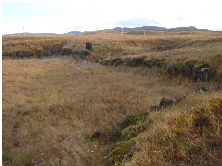
Mynd 3. Rétt eða aðhald nærri Rjómaskálanum.

Um 88 metra austur af sumarbústað og 16 metra norður af Minni-Vallalæk stendur rétt. Réttin er 40 metra austur af rústum rjómabúsins (mynd 2 rúst 7). Ekki er getið um rétt þessa í örnefnaskrá.