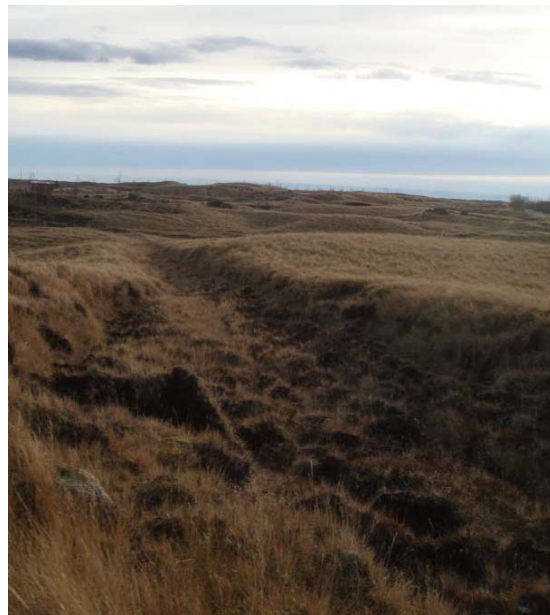
Mynd 1. Gamla þjóðleiðin upp Land, mörkuð í landið.