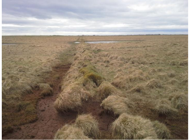
Mynd 3. Garðurinn frá Nesbrú, sjá má skemmdir á honum neðst á myndinni.

Staðhættir: Að veginum Nesbrú liggja þrjár garðar en þeir stoppa við Nesbrú. Garðarnir eru greinilega landamerkjagarðar til að skipta mýrinni. Sá garður sem næst er Óseyri er þeirra stytstur. Um miðja Nesbrú þar sem hún liggur um Nesrima kemur annar garður úr suð austri og stoppar við Nesbrú. Hnit er tekið þar sem garðurinn kemur á Nesbrú.