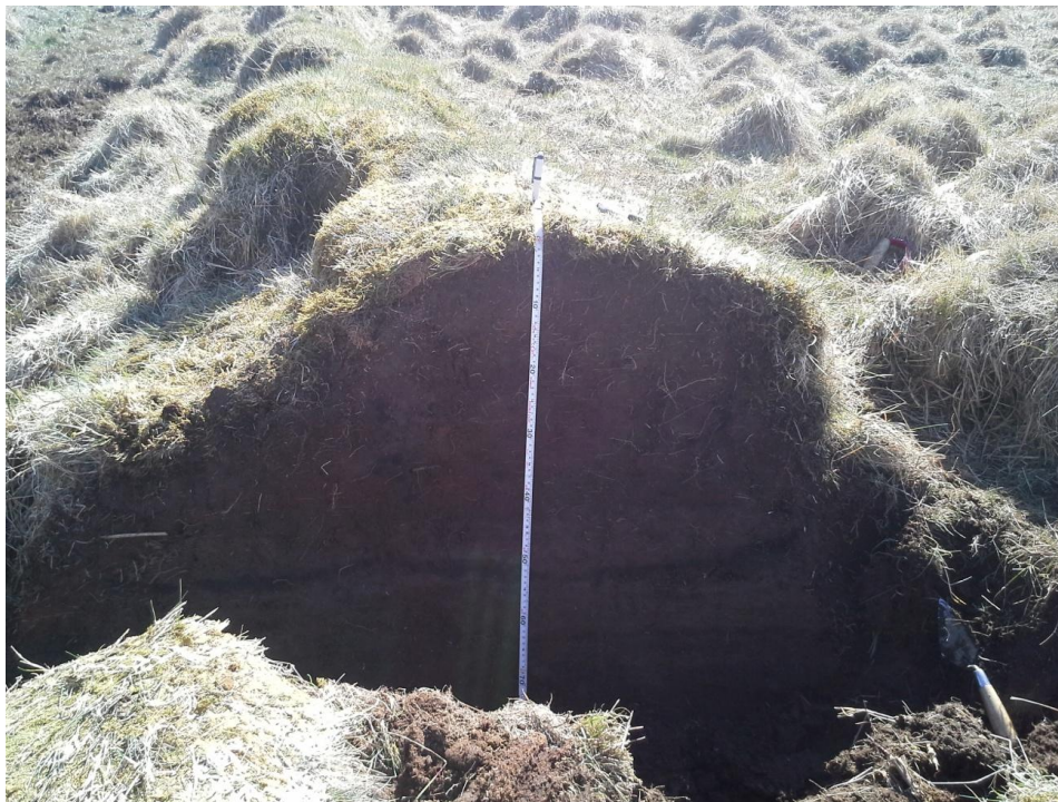
Mynd 5. Snið í garðinn. Gjóska í óhreyfðu lagi er greinileg.