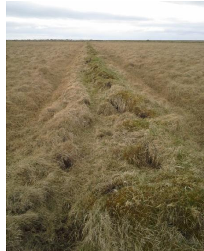
Mynd 2. Garðurinn eftir að skemmdum sleppir við Nesbrú.

Minjalýsing: Garðurinn er 313 metrar og hlaðinn úr torfi. Garðurinn er um 2 metrar á breidd og 40 cm hár.