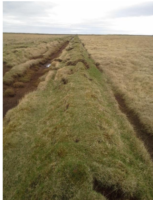
Mynd 1. Garðurinn vestanmegin við Nesbrú.

Minjalýsing: Garðurinn er 1.200 metrar og hlaðinn úr torfi. Garðurinn er um 2 metrar á breidd og 100 cm hár þar sem hann er hæstur. Garðurinn nær ekki alveg heim að skurði sem kallast Markaskurður og þar heldur Nesbúin áfram í átt að Kaldaðarnesi. Rof eru í garðinum á