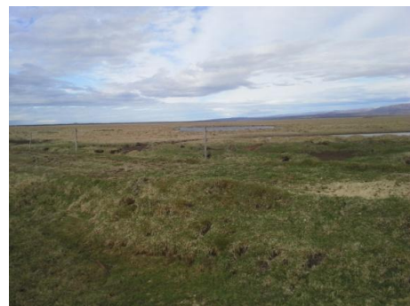
Mynd 2. Nesbrú er töluvert upphlaðinn og á nokkrum stöðum er hún 1 meter á hæð.

Minjalýsing: Gróður er sá sami á henni og í umhverfinu í kring utan við að fífur virðast ekki vaxa á henni. Það gefur til kynna að hún sé þurrari en mýrin í kring. Það hefur verið takmarkið til að auðvelda fólki förina yfir mýrina. Hestar eru hafðir á beit í mýrinni austan við Engjavegin. Nesbrú er 2,5 km en hverfur þá nærri Kaldaðarnesi. Vegurinn er