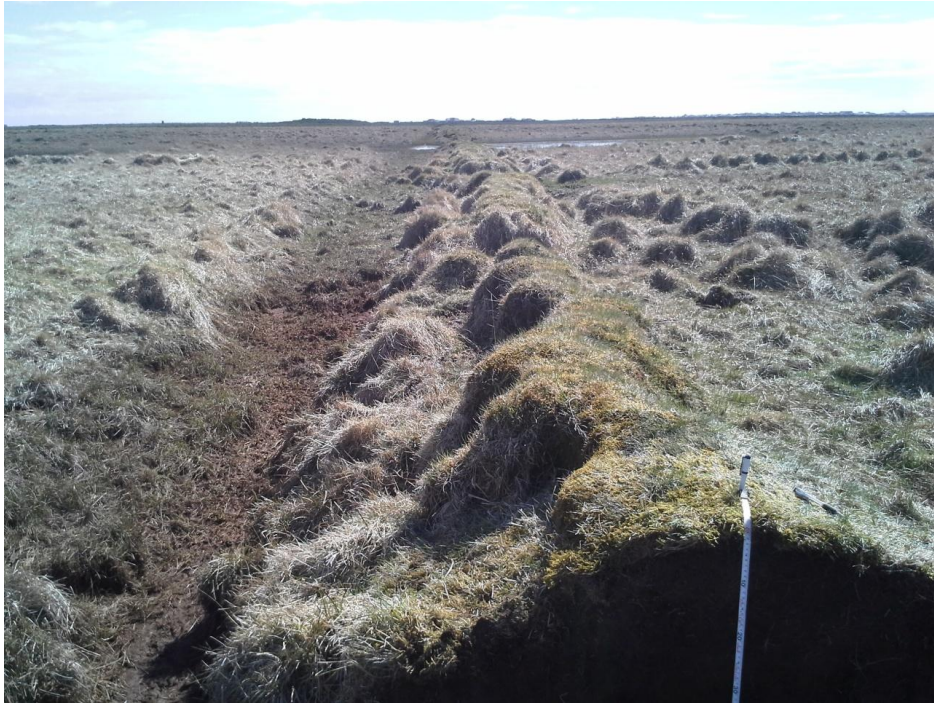
Mynd 4. Garðurinn sem snið var tekið í og pæla norðan við garðinn