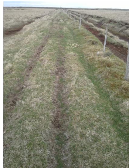
Mynd 1. Hestastígar eru á veginum (Nesbrú).