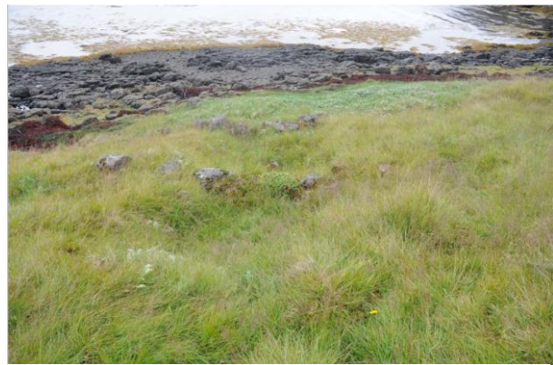
Mynd 7. Rúst af nausti í fjörinni neðan við Kirkjuból.