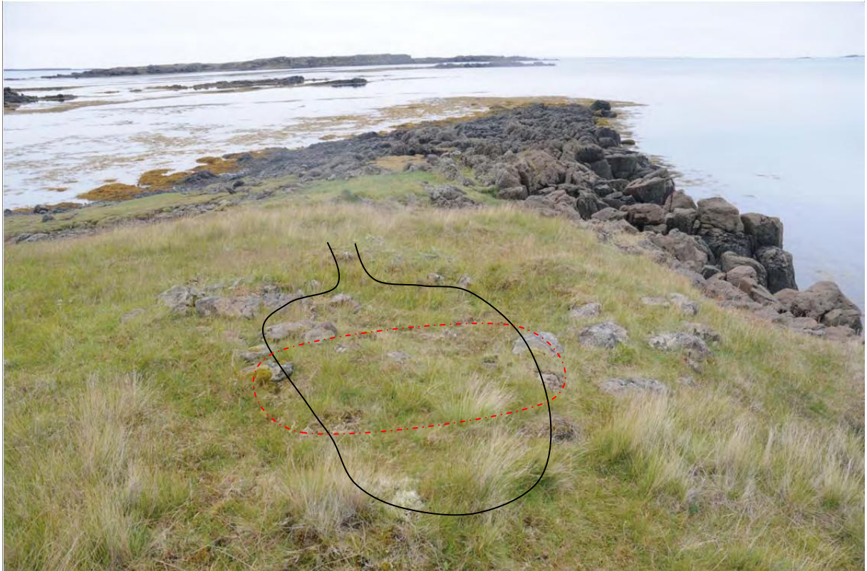
Mynd 2. Rústin eins og hún var fyrir uppgröft, rétt sér móta fyrir henni á yfirborði. Rauði kassinn markar hvar könnunarskurður var fyrst tekin en restin síðan opnuð til að fá betri upplýsingar.