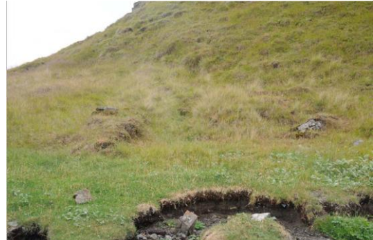
Mynd 3. Rústir, mjög líklega naust nærri sjóbúðinni.

Minjalýsing: Aðeins eru greinilegir þrír veggir og eftitt að gera sér grein fyrir hvort um sé að ræða eitt eða tvö hólf. Sést í grjótt úr veggjum en rústin er mjög gróin. Hleðslur eru um 40 cm á hæð og 7 metra langur veggur liggur í austur/vestur og beygir til suðurs og veggjarbrot sem eru 4x3 metrar.