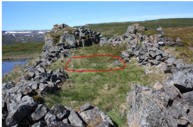
Mynd 11. Grafið var í réttina (027) og sýnir rauða línun hvar skurður var gerður.

Minjalýsing: Réttin er mjög nærri framkvæmdum við nýjan veg. Hún var merkt vel og tekin í hana könnunarskurður