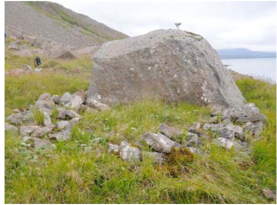
Mynd 9. Helgustekkur (025).