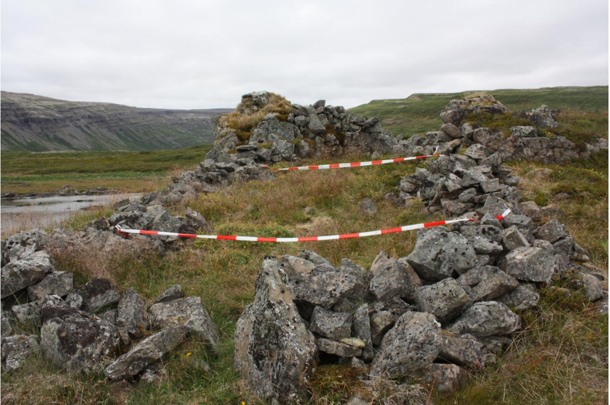
Mynd 12. Réttin eftir að hún var merkt af fornleifafræðingum. Síðar var hún merkt af starfsmönnum Vegagerðar.