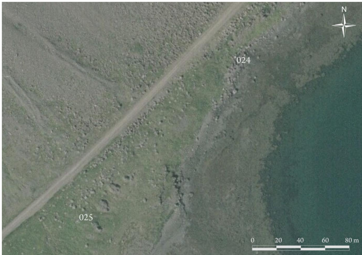
Kort 3. Minjar 024 (M3) og 025 (M4) í Kerlingarfirði í landi Kirkjubóls.

Minjalýsing: Stekkurinn er 30 metra suðaustur að núverandi vegi. Stekkurinn stendur við stórann stein sem notaður er sem ein hlið hans á tvennan hátt. Tvö hólf eru byggð við steininn og eru hleðslur lágar en sjáanlegar á yfirborði. Sjá kort 3.