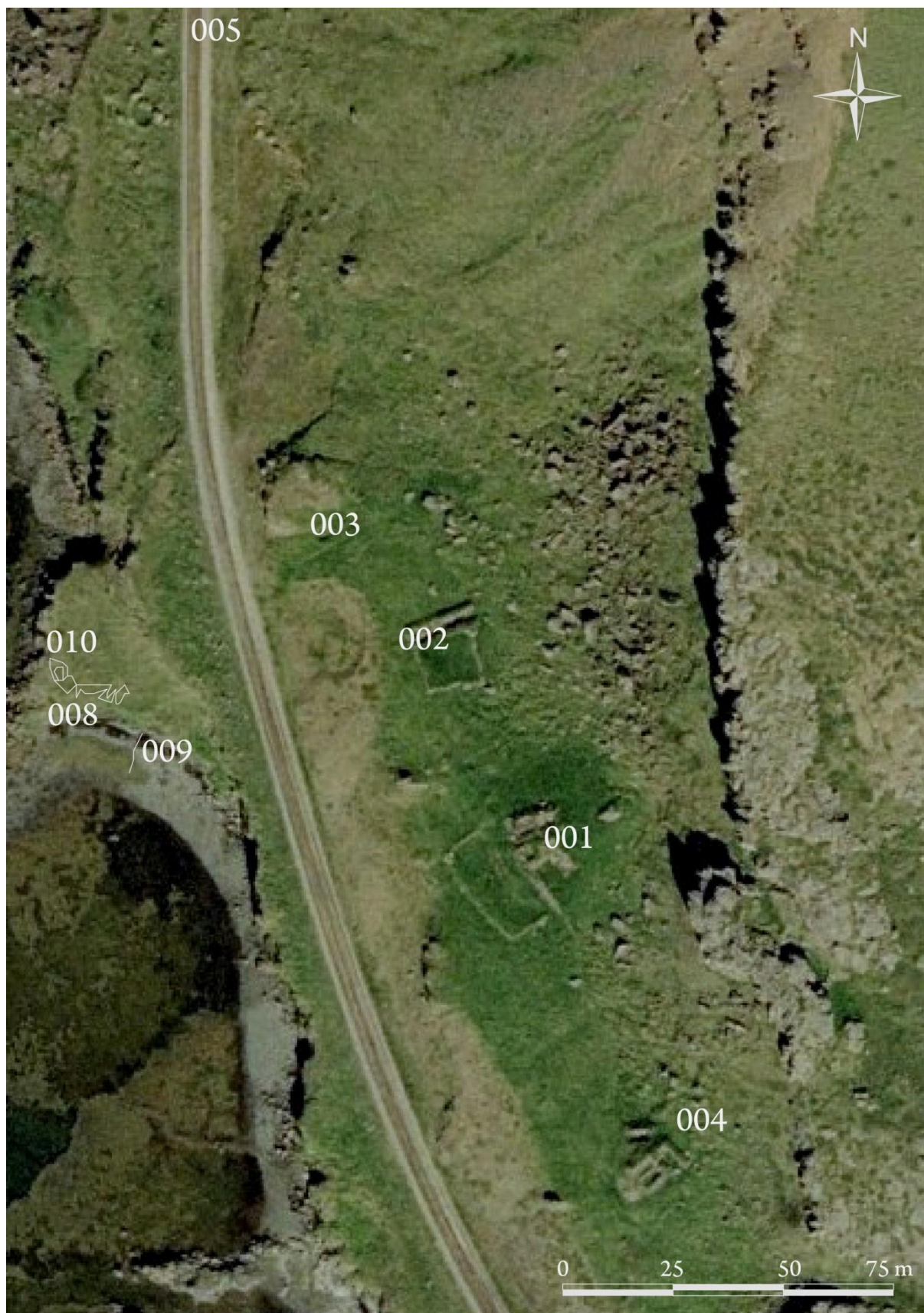
Kort 1. Minjar í landi Litlanes. Könnunarskurður í rúst 010 (M8).