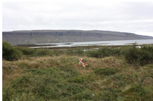
Mynd 10. Hugsanlegar rústir af gömlu seli (017).

Minjalýsing: Rústin er tvíhólfa en erfitt að átta sig á henni þar sem að hún er að hluta til gróin víði. Ekki sér í hleðslur því rústin er mjög gróin en hæst er hún um 80 cm.