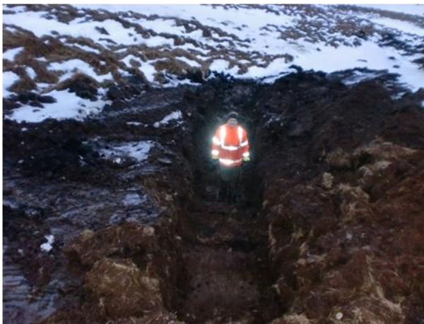
Mynd 5. Könnunarskurður D. Mynd tekin í NA.

Ekki er vitað hvar kirkja var staðsett en vestan við bæjarhólinn er flatur stallur í brekku sem er nokkuð hringlaga (BS-139612-80:26). Hugsanlegt er að þetta sé útflött kirkjutóft og grafreitir og passar það við lýsingar í örnefnaskrá. Svæðið er um 20 metrar að utanmáli og er við hlið bæjarhóls en algengt var að bænhús og grafreitir væru nærri bæ. Þetta svæði er ekki nærri fyrirhugðum veg. Litlar líkur eru taldar á því að kirkjugarður hafi verið þar sem fyrirhugað er að leggja veg.