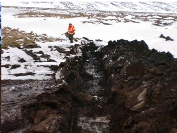
Mynd 6. Könnunarskurður C. Mynd tekin í NA.