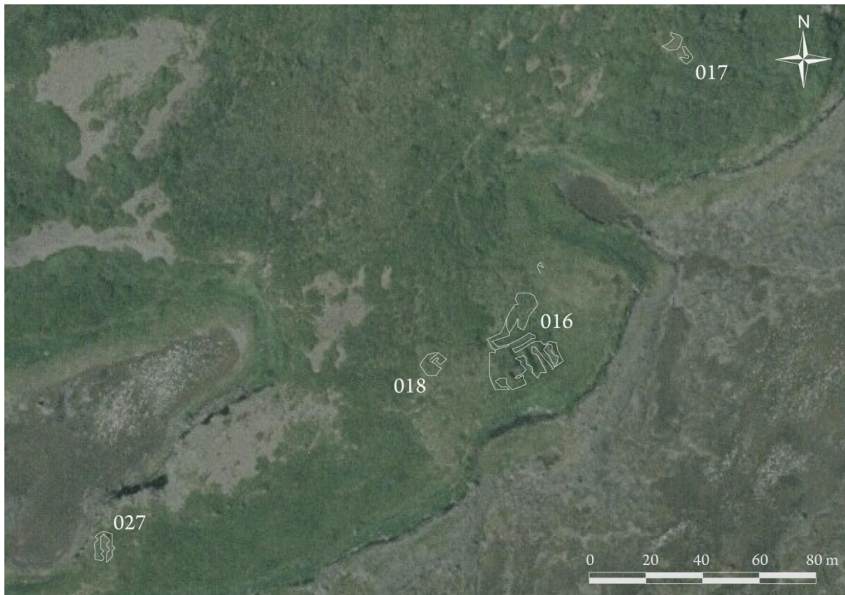
Kort 4. Innmælingar á minjum í landi Eiðshús (Fjarðarsel). Grafir var skurður í rúst 027.