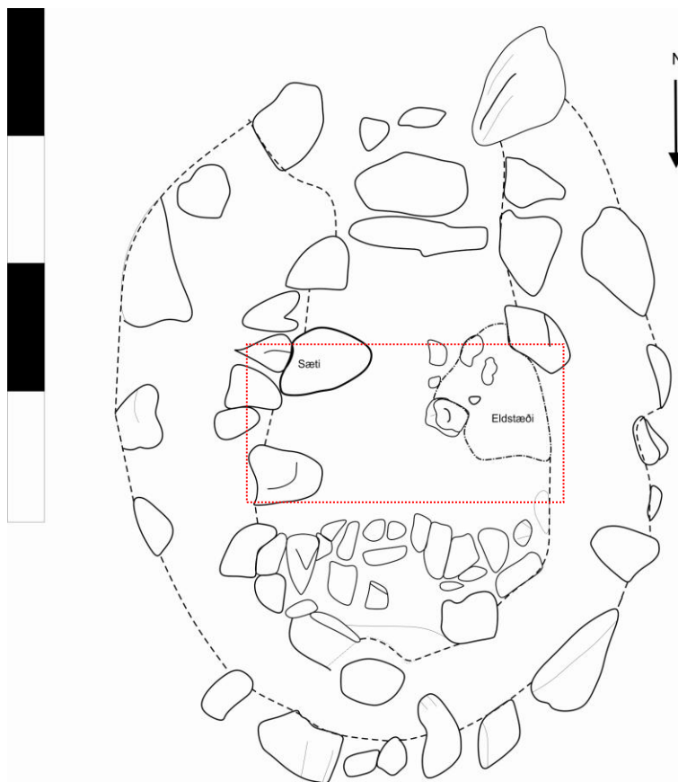
Teikning 1. Teikning af rústinni. Rauði kassinn sýnir hvar könnunarskurður var fyrst tekinn en rústin var síðan opnuð frekar.