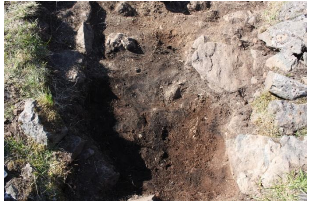
Mynd 1. Inngangur. Eldstæði og steinn sem hugsanlega var notað sem sæti.

Rannsóknin leiddi í ljós að rústin á Litlanesi hefur að öllum líkindum verið verbúð eða hluti verbúðar. Við hliðina á henni og nokkuð neðar eru naust og við ströndina góð aðstaða til að ýta bátum úr vör. Þar sem gjóskulög eru mjög vandfundinn á Vestfjörðum er erfitt að aldursgreina verbúðina en hún gæti verið mjög gömul. Ekki fleiri en tveir menn geta hafa hafst við í þessu litla rými en nokkuð vel farið um einn mann. Fleti hefur líklega verið í enda verbúðarinnar, eldstæði og steinn sem einn maður hefur getað setið á þegar hann notaði eldstæðið.