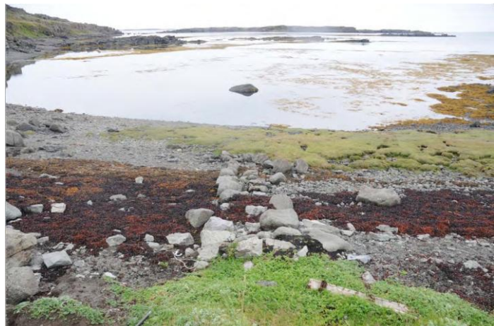
Mynd 4. Bryggja [009].

Minjalýsing: Hleðslan er sjö metrar á lengd og einn metri á breidd og liggur frá “naustunum” að flæðamáli.