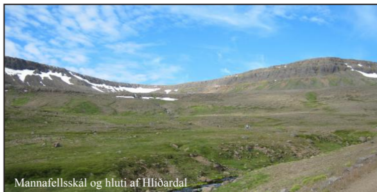
Mannafellsskál og hluti af Hlíðardal

Önnur saga segir að einu sinni hafi ferðamaður orðið úti á Skálavíkurheiði. Þegar hann fannst var hann grafinn þar sem heiðin er hæst og kross settur á kuml hans. Með því yrði hann vegvísir þeim sem um heiðina færu. Að fornum síð taldi hver ferðamaður sér skylt að leggja stein á kumlið þegar hann átti leið þar um. Stækkaði rústin þannig smám saman. Upp úr kumlinu átti varðan síðan að hafa verið gerð og henni jafnan haldið við, en einnig endurbýggð þegar þess þurfti.