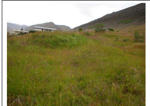
Mynd 11. Tóft 011 séð til suðurs.

Hættumat: Mikil hætta. Vegna framkvæmda.