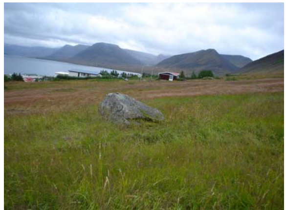
Mynd 6. Imba 006 séð til suðurs. (Brúna húsið hægra megin á mynd er Hlíðargata 20). Ljós. ÓLA.

Hættumat: Mikil hætta. Vegna framkvæmda.