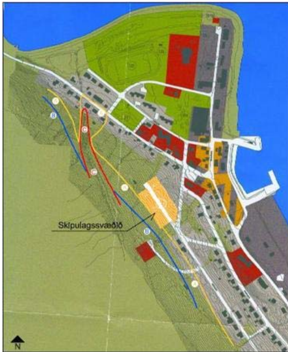
Staðsetning reits á staðfestu aðalskipulagi. Mkv. 1/5000