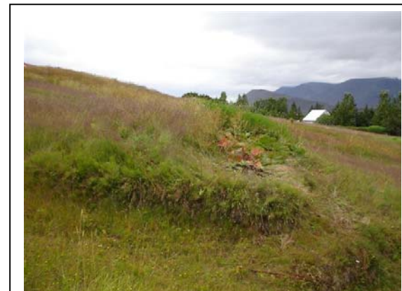
Mynd 10. Tóft 010 séð til norðurs.

Hættumat: Mikil hættu. Vegna framkvæmda.