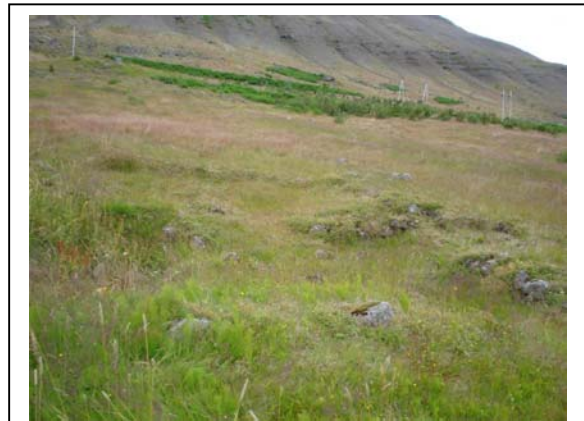
Mynd 4. Tóft 003 séð til vesturs.

Hættumat: Mikil hættu. Vegna framkvæmda.