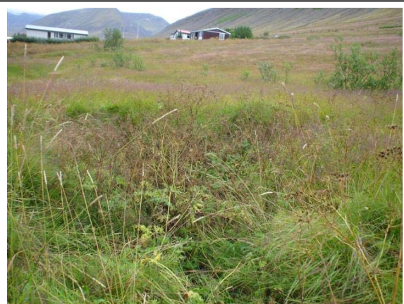
Mynd 9. Tóft 009 séð til suðurs. Hlíðargata 20 fyrir miðri mynd efst.

Hættumat: Mikil hættu. Vegna framkvæmda.