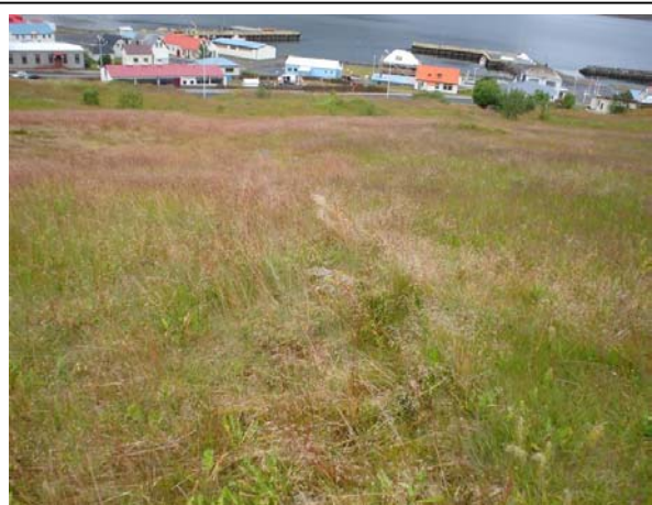
Mynd 7. Túngarður 007 séð til austurs. Ljós. ÓLA.

Hættumat: Mikil hætta. Vegna framkvæmda.