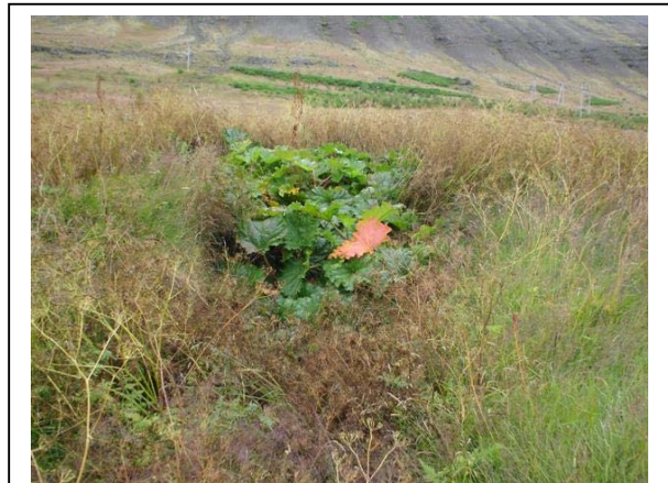
Mynd 14. Tóft 014 B séð til vesturs. Ljós. ÓLA.

Hættumat: Mikil hætta. Vegna framkvæmda / rasks.