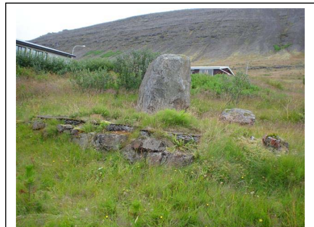
Mynd 15. 015 séð til vesturs. Ljós. ÓLA.

Hættumat: Mikil hætta. Vegna framkvæmda / rasks.