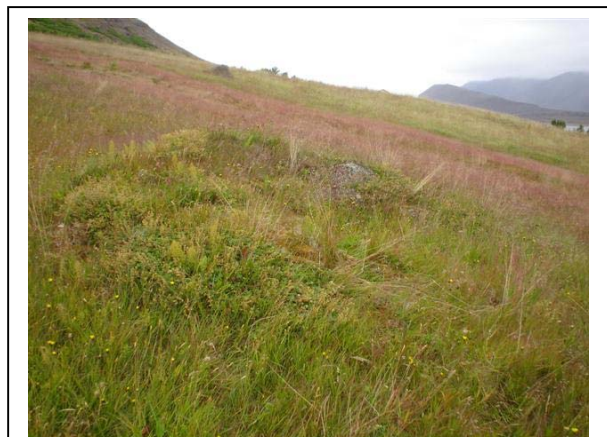
Mynd 13. Tóft 013 séð til norðurs.

Hættumat: Mikil hætta. Vegna framkvæmda.