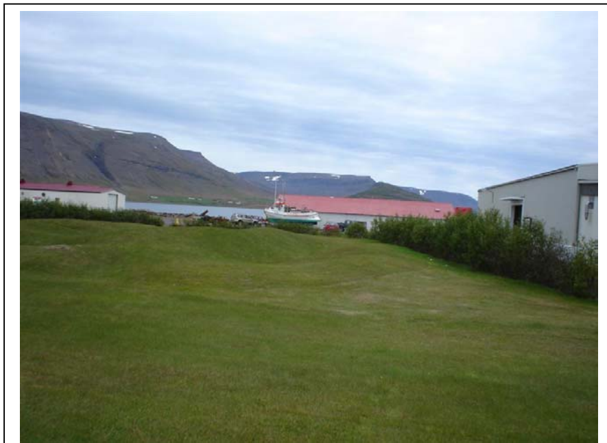
Mynd 2. Rústahóll 001, séð til austurs. Frystihúsið hægra megin á myndinni. Ljós. ÓLA.

Umrædd fornleifaskráning takmarkast við ofangreind skipulagssvæði. Ekki er um tæmandi upptalningu á fornleifum á jörðinni að ræða.