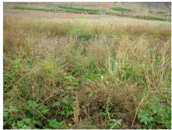
Mynd 8. Tóft 008 séð til austurs. Imba (006) í baksýn.

Hættumat: Mikil hættu. Vegna framkvæmda.