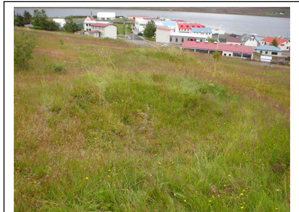
Mynd 12. Tóft 012 séð til norðausturs. 011 í baksýn. Ljós. ÓLA.

Hættumat: Mikil hætta. Vegna framkvæmda.