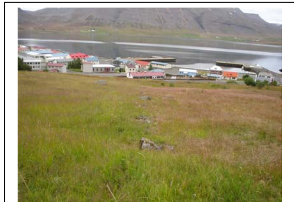
Mynd 5. Túngarður 004 séð til austurs. (Vinstra megin á mynd sést Imba 006).

Hættumat: Mikil hættu. Vegna framkvæmda.