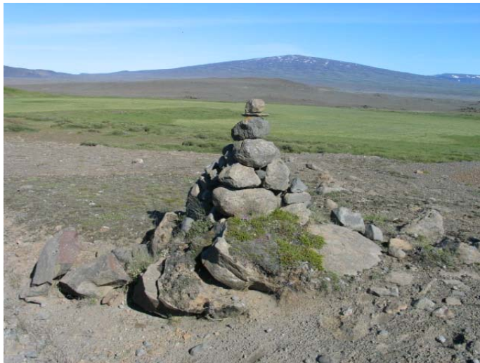
Mynd 5. Varða 5.