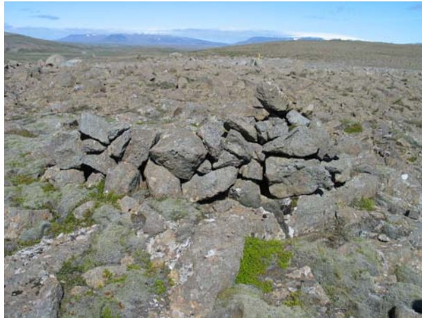
Mynd 1. Varða 1.