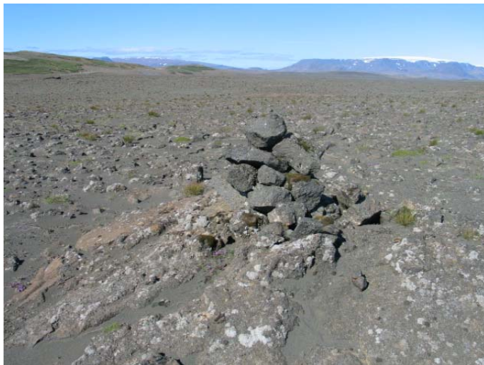
Mynd 15. Varða 15.