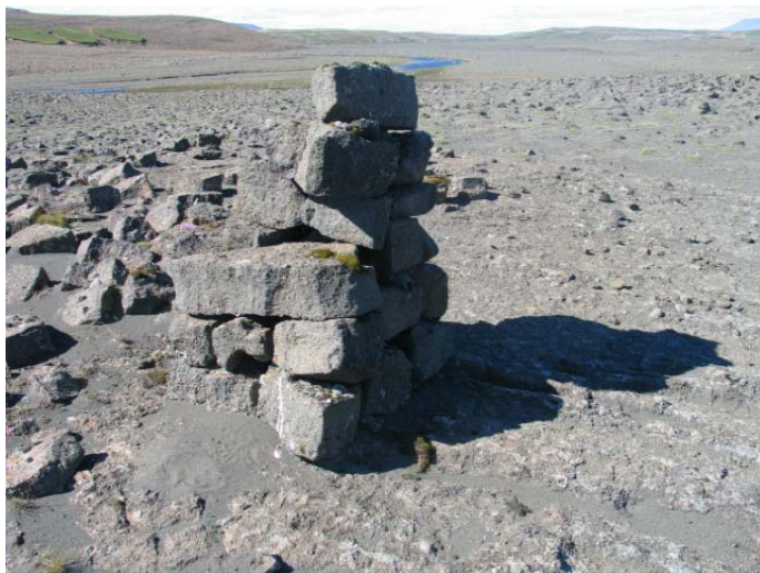
Mynd 9. Varða 9.