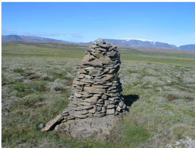
Mynd 6. Varða 6.