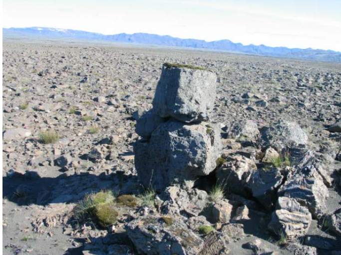
Mynd 16. Varða 16.