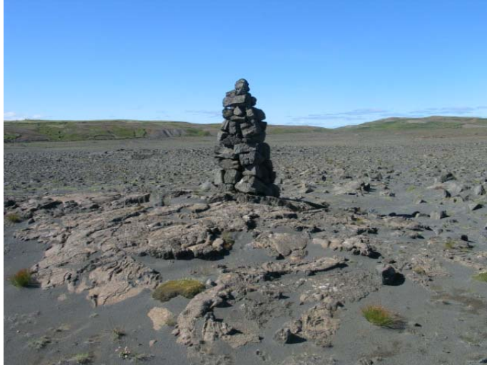
Mynd 13. Varða 13.