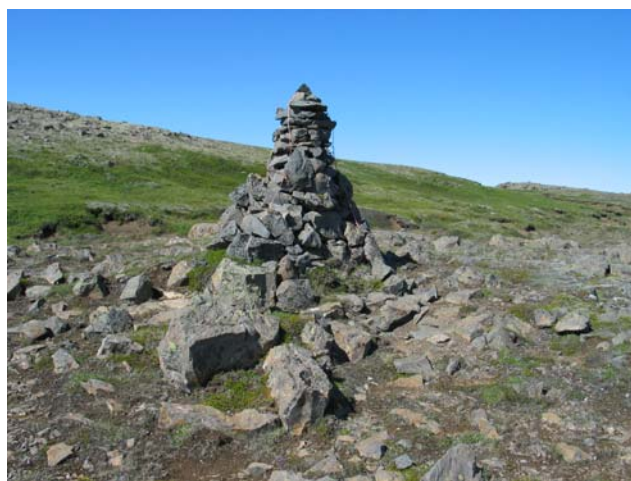
Mynd 3. Varða 3.