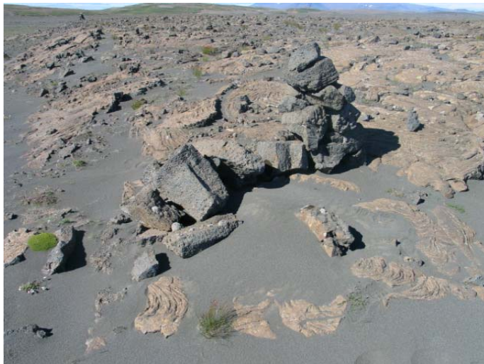
Mynd 11. Varða 11.