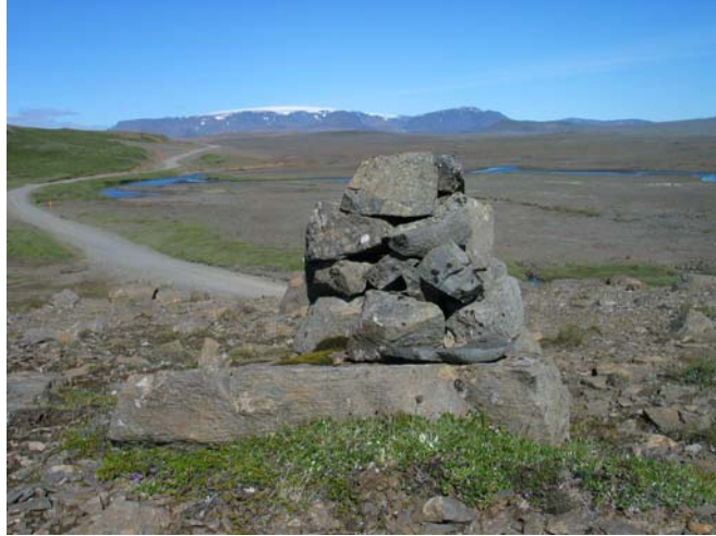
Mynd 4. Varða 4.