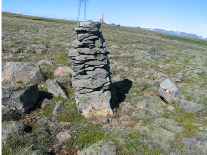
Mynd 7. Varða 7.