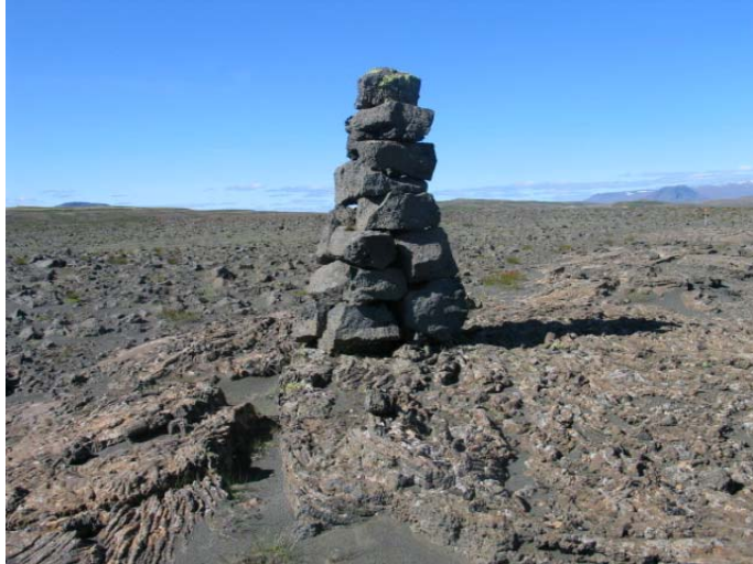
Mynd 10. Varða 10.