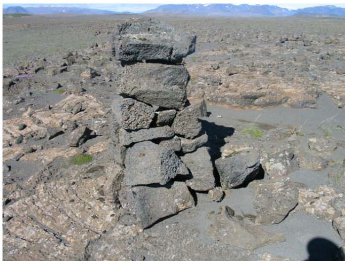
Mynd 12. Varða 12.