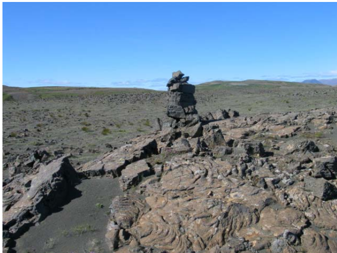
Mynd 14. Varða 14.