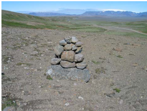
Mynd 2. Varða 2.