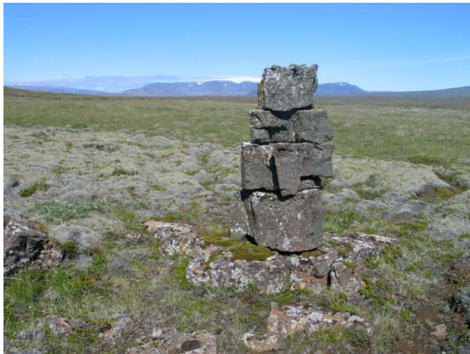
Mynd 8. Varða 8.