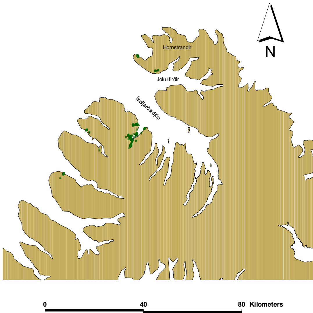
Kort 1. Dreifing fornleifaskráðra minjastaða í Isafjarðarbæ.