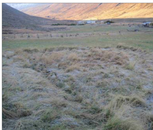
Kálgarðurinn við bæjarhólinn.

Við vestanverðan bæjarhólinn er afmarkaður garður allstór. Garðurinn er nokkuð hækkaður upp og er mjög greinilegur. Hann er ferhyrndur og er nálægt