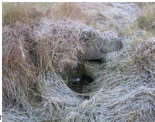
Upphækkun á vegi

3 umför eru sjáanleg, steinninn er vaxinn mosa.