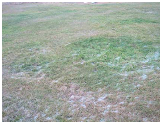
Dældirnar tvær í túni.

Um 10-15 m suðaustur af bústaðnum við rafstöð eru tvær fremur greinilegar dældir í túninu hlið við hlið. Sú stærri er hringlaga, um 1 m í þvermál. Mjög sléttar orðnar.