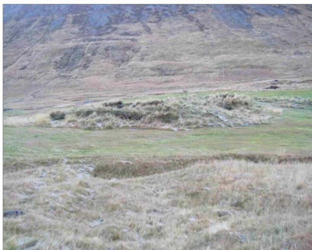
Bæjarhóllinn á Fossum.

„Farið er inn í Engidal og framhjá sjálfu bæjarstæði Engidals, sunnan Langár rétt við virkjunina er bæjarstæðið. Bæjarstæðið stendur í miðju ræktuðu túni.