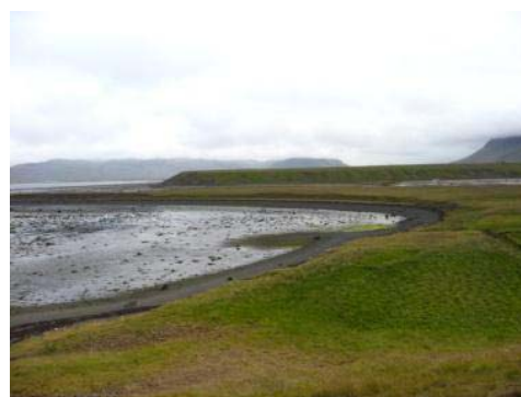
Mynd 24. Salthólmavík.