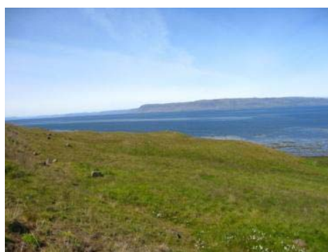
Mynd 34. Kringlumýrarhryggur.