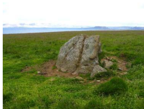
Mynd 23. Filipus/ía.