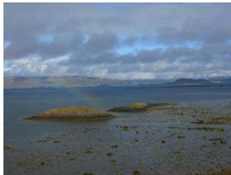
Mynd 1. Salthólmar.