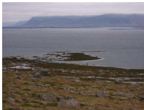
Mynd 33. Rauðmagatangi.