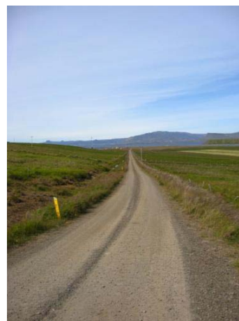
Mynd 28. Langavitleysa.