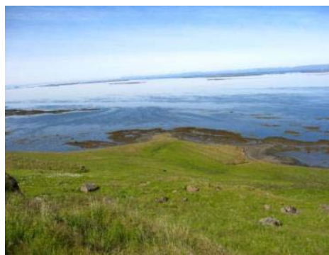
Mynd 20. Litla – Þingeyri.