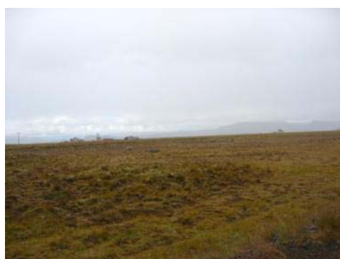
Mynd 4. Ósamelur þar sem hann er gróinn.