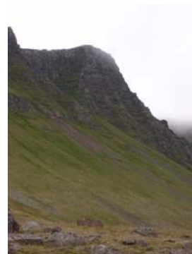
Mynd 14. Sokkustöng.

Lýsing / Staðhættir: Talað um Litlu- og Stóru Sokkustöng. Litla nær að Tvíhlíðinni, en stóra kemur þar á eftir. Brattir klettur í fjallinu og ná þeir neðar þar, en annarsstaðar í hlíðinni. Nafngiftin kemur til af sögu er segir frá handsömun sokkóttar hryssu þarna á brúninni.