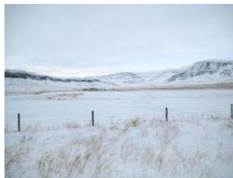
Mynd 38. Lönguflatir.