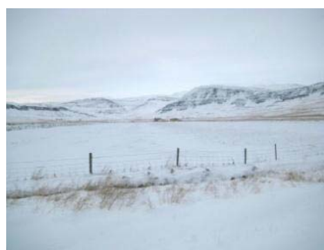
Mynd 39. Erlendstóft.