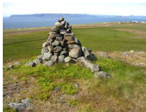
Mynd 7. Varða á Karlsholti.