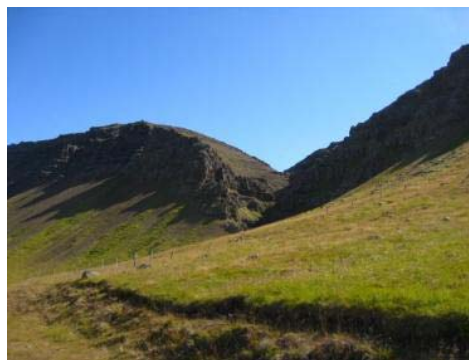
Mynd 22. Deild.