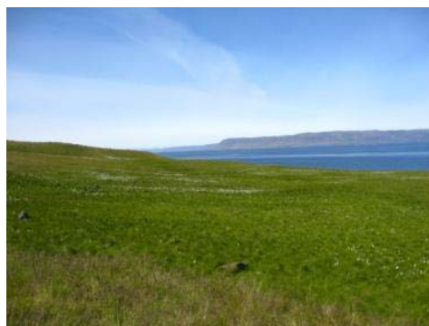
Mynd 26. Seljamýri.