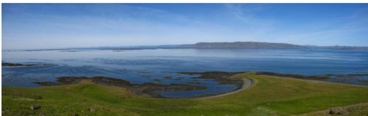
Mynd 21. Litla – og Stóra Þingeyri.