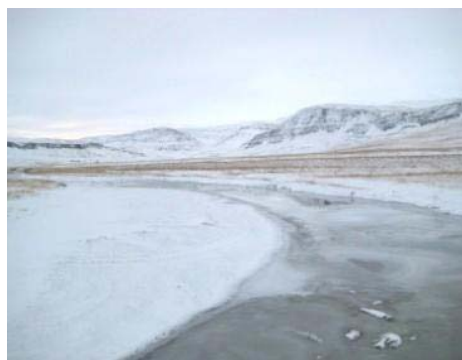
Mynd 37. Staðarhólsá.