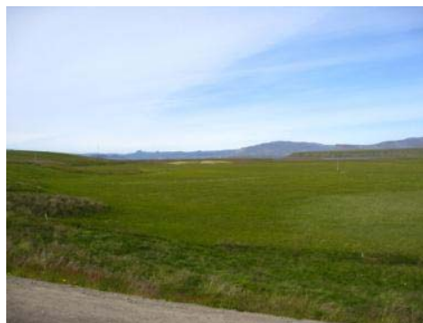
Mynd 5. Álfthagi.