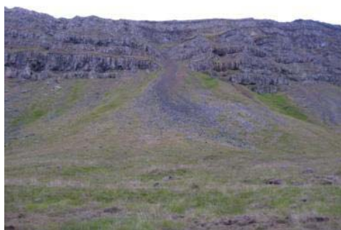
Mynd 10. Geldfjástígur.