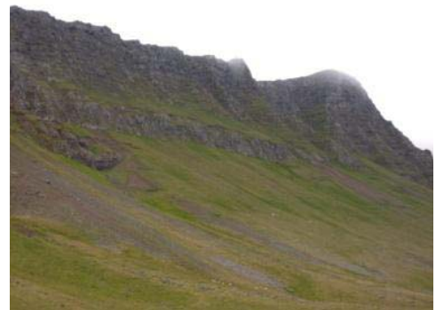
Mynd 25. Tvíhlið.