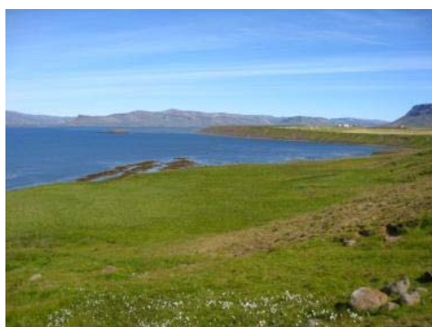
Mynd 11. Kringlumýri.