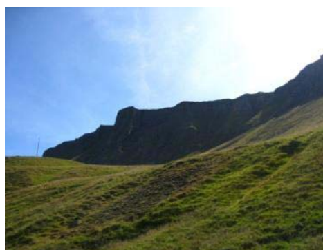
Mynd 29. Hólahvolf.