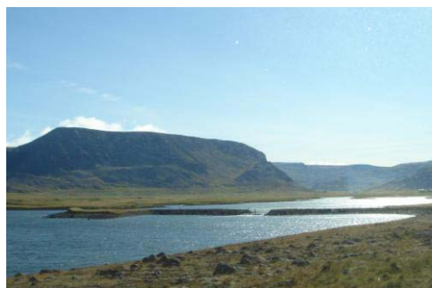
Mynd 3. Orustuhólmi sést til vinstri við stíflugarðinn.