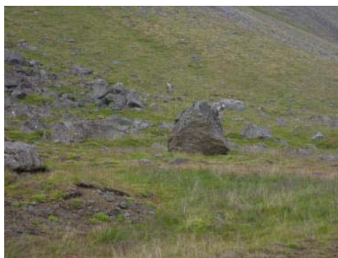
Mynd 35. Húsbóndinn.