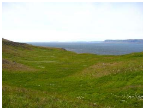
Mynd 9. Stekkjardalur.