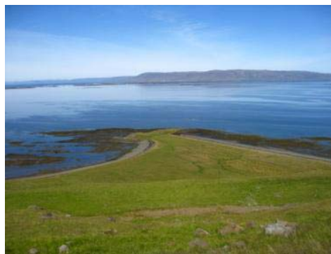
Mynd 18. Þingeyri.