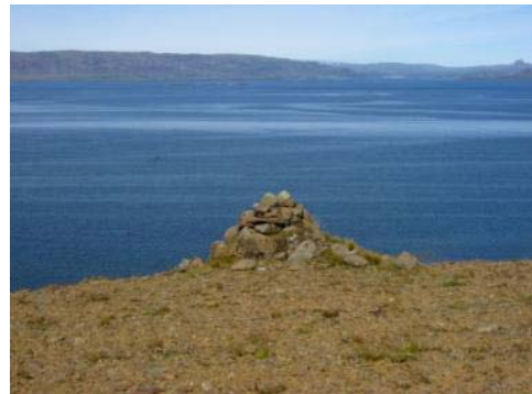
Mynd 15. Varða á Digrimúla hlaðinn vegna landmælinga Danska herforingjaráðsins.