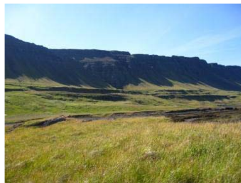
Mynd 27. Tjaldaneshlíð.