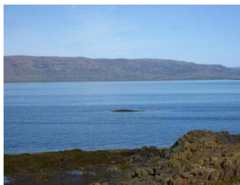
Mynd 32. Þingeyrarsker.