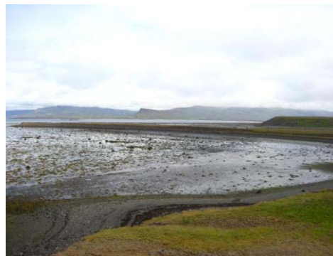
Mynd 2. Sölvatangi.