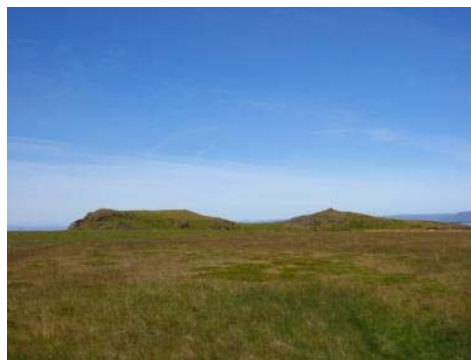
Mynd 31. Þingeyrarhaus.