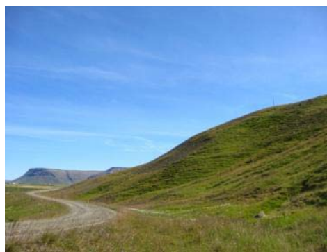
Mynd 13. Hólar.