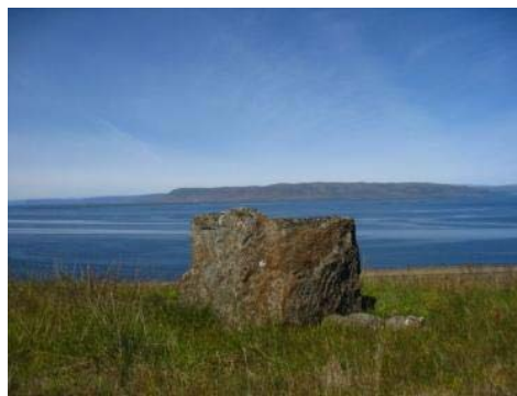
Mynd 30. Gróusteinn.