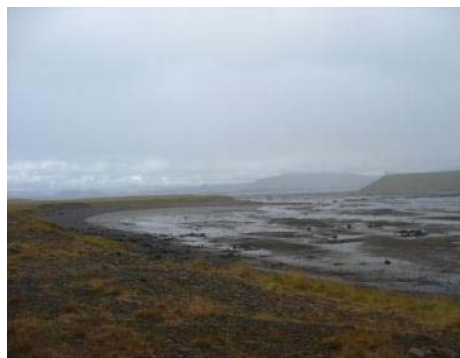
Mynd 36. Ljósavík.