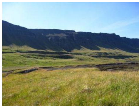
Mynd 17. Hjallar.

Lýsing / Staðhættir: Grasivaxnir klettabekkir fyrir neðan Hjallahlíð (25) sem ná alla leið út að gilinu Deild (28a). Bærinn sem stóð á