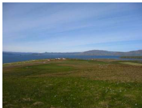
Mynd 6. Skeiði. Mynd tekin af Karlsholti yfir Tjaldanesið til norðurs. Skeiði var graslaus melur suður frá gamla bæjarstæðinu lengst til vinstri á myndinni.