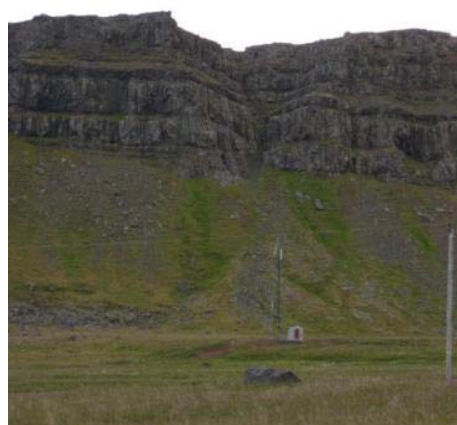
Mynd 8. Herdísargjá.