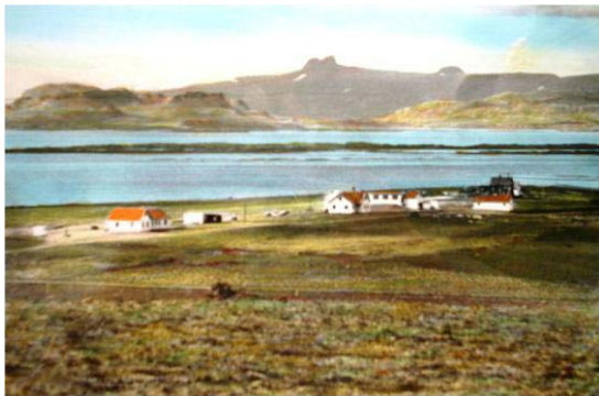
Mynd 1. Tjaldanes um 1960. Horft til NNV. Myndin er máluð og tekin með aðdráttarlinsu frá Karlsholti