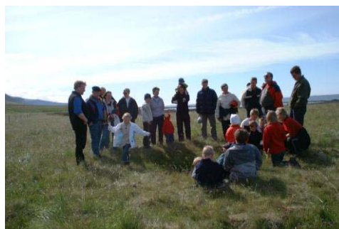
Mynd 19. Völundarhúsið skoðað