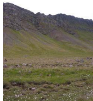
Mynd 12. Miðdagsskriður.