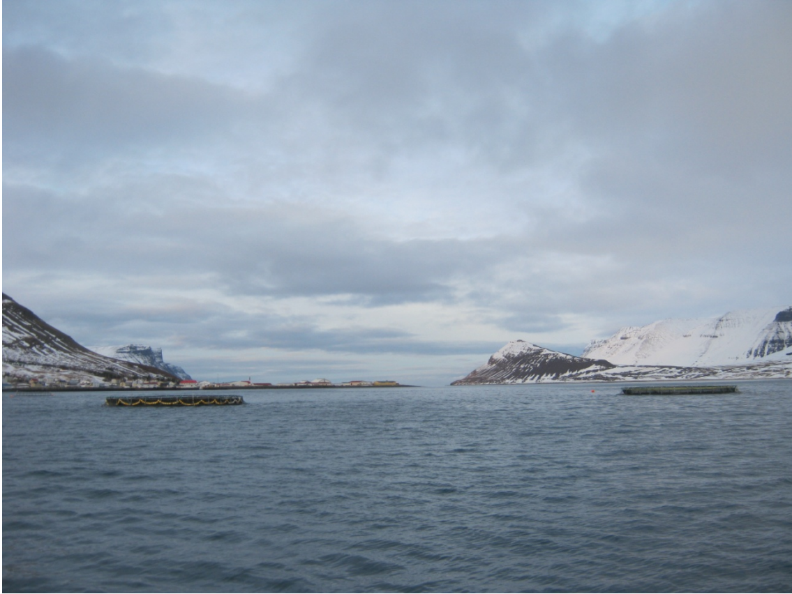
Mynd 2. Kvíar frá Sjávareldi ehf í Dýrafirði, horft út fjörðinn. Stöð A var tekin við kví sem er hægra megin (sunnan megin) á myndinni.