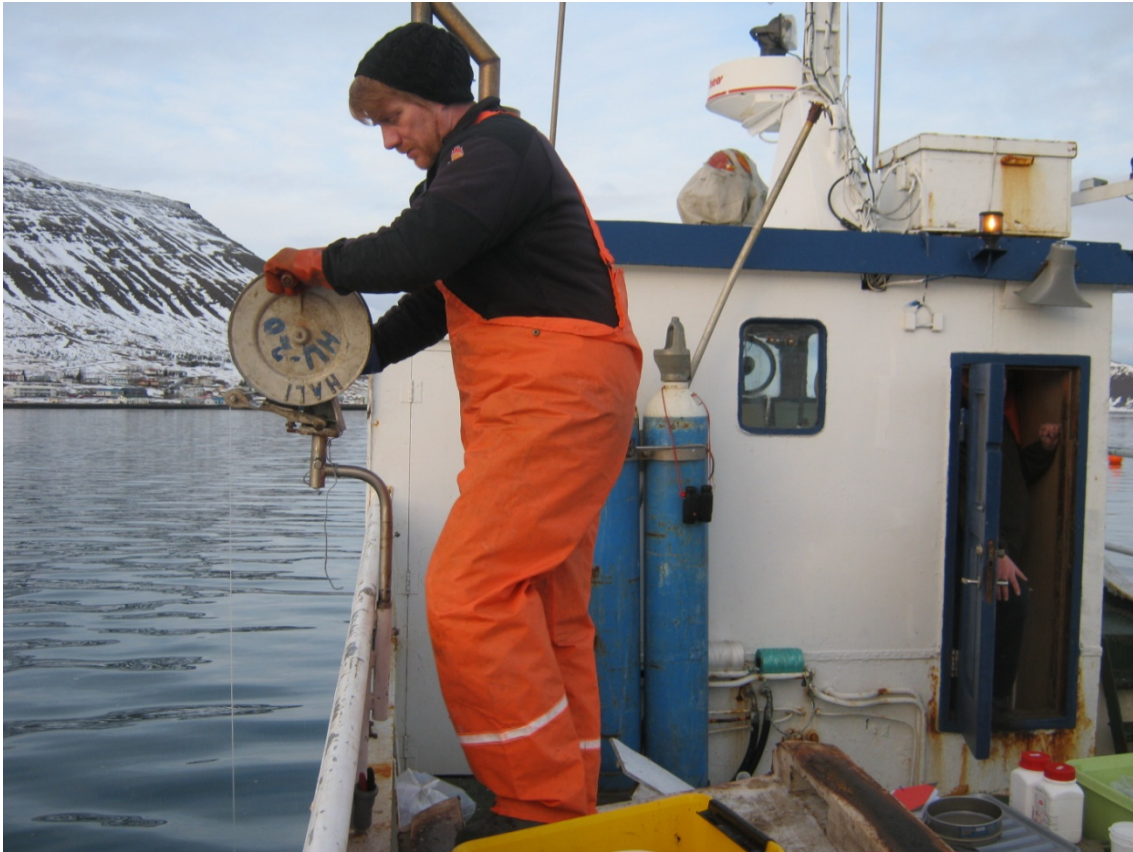
Mynd 3. Greiparsýni tekin með Van Veen greip og „nýmóðins“ færavindu.

Tekin voru þrjú sýni á hverri stöð til greiningar á botndýralífi. Skráð var setgerð, litur á sýninu, sérstök lykt og hvort lífverur sáust (tafla 1). Þegar lykt er skráð þá er átt við að það finnst brennisteinslykt af sýninu en ekki útilokað að um aðra lykt sé að ræða þegar hún er væg (lítil).